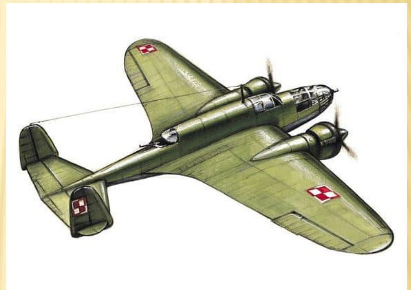
PZL P37A Łoś