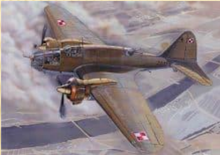
PZL P37B Łoś