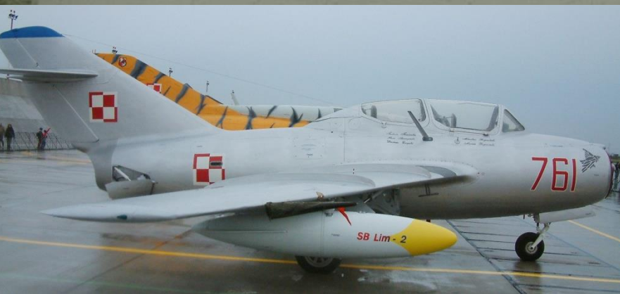
Na zdjęciu obok: samolot SB Lim-2

Przejęciowo w latach 1970-1975 zakłady nosiły nazwę WSK Delta-Mielec, a od 1975 roku przywrócono przedwojenną nazwę Wytwórnia Sprzętu Komunikacyjnego "PZL-Mielec". 19 października 1998 przedsiębiorstwo państwowe przekształcono w spółkę Skarbu Państwa pod nazwą Polskie Zakłady Lotnicze Sp. z o.o, w skrócie PZL Mielec. 16 marca 2007 roku Agencja Rozwoju Przemysłu sprzedała 100% udziałów PZL Mielec amerykańskiej spółce United Technologies Holdings S.A. za 66 mln zł, przez co zakłady stały się spółką zależną Sikorsky Aircraft Corporation. W lipcu 2015 roku spółka Sikorsky Aircraft Corporation została zakupiona przez amerykański koncern Lockheed Martin za 9 miliardów dolarów.