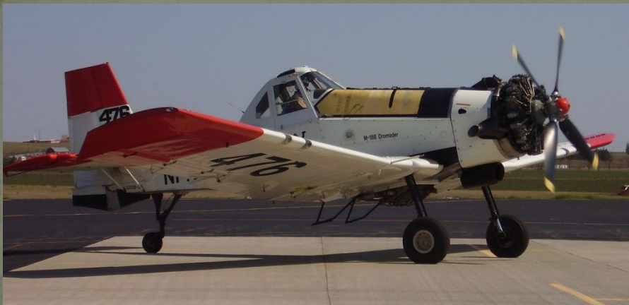
PZL M18B Dromader