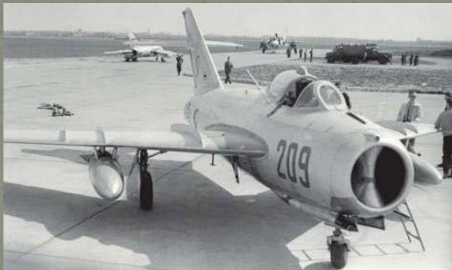
Fot. 40 Samolot Lim 5 na licencji MiG 17F na mieleckim lotnisku.

W 1949 roku zakłady zmieniły nazwę na Wytwórnia Sprzętu Komunikacyjnego, Zakład nr 1 w Mielcu, w skrócie WSK-1 Mielec. W 1950 roku zdecydowano o znacznej rozbudowie zakładów, w związku z planami masowej produkcji licencyjnej samolotów radzieckich. Podjęto produkcję odrzutowych myśliwców MiG-15 i MiG-17, jako Lim-1, Lim-2, Lim-5, Lim-6. Wymyślono także kilka pomysłów na własne samoloty - PZL M-4 Tarpan, PZL S-4 Kania, lecz nie weszły do produkcji.