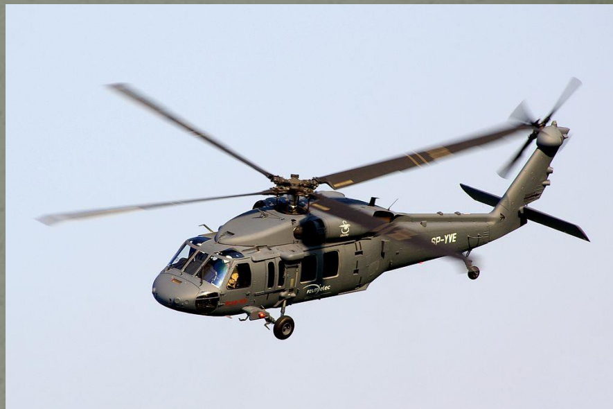
S-70i Black Hawk