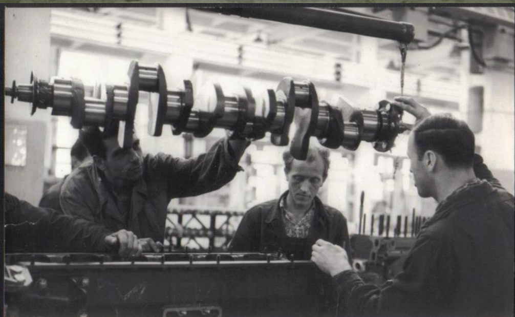
Wytwórnia Sprzętu Komunikacyjnego w Mielcu rozpoczyna seryjną produkcję wysokoprężnych silników na licencji angielskiej firmy Leyland. Silniki przeznaczone są dla zakładów w Jelczu, gdzie wmontowane zostaną do wielkich 10-tonowych samochodów ciężarowych „Jelcz 315”. Na zdj.: w hali montażowej

Pomieszczenie biura projektowego Zakładów w Mielcu