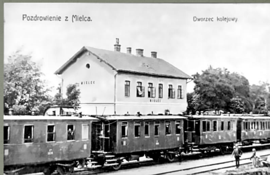
Pocztówka ukazująca Dworzec kolejowy w Mielcu. Fotografia prawdopodobnie wykonana przez Jadernych .