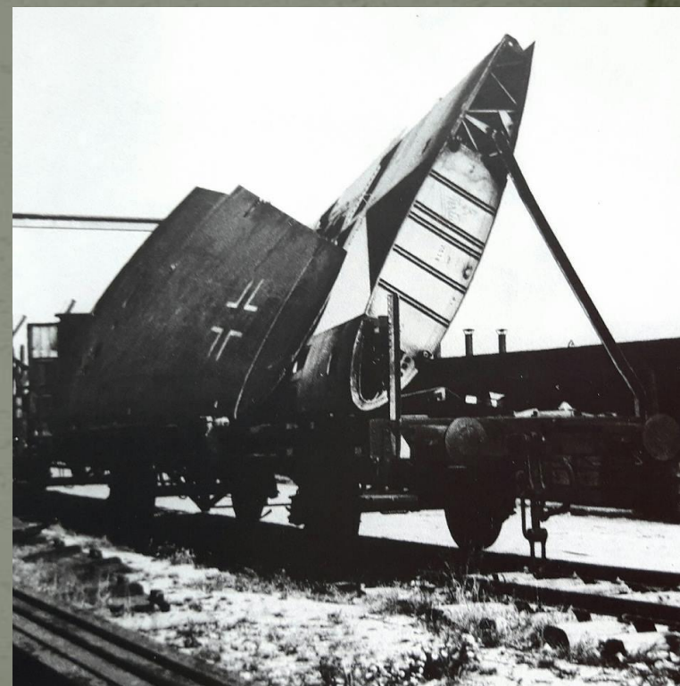
Uszkodzone skrzydła samolotów niemieckich przywiezione do remontu w Flugzeugwerk Mielec