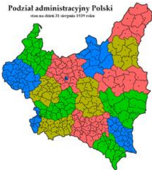
Podział administracyjny Polski stan na dzień 31 sierpnia 1939 roku